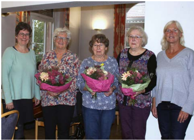
30 Jahre Frauenfrühstück